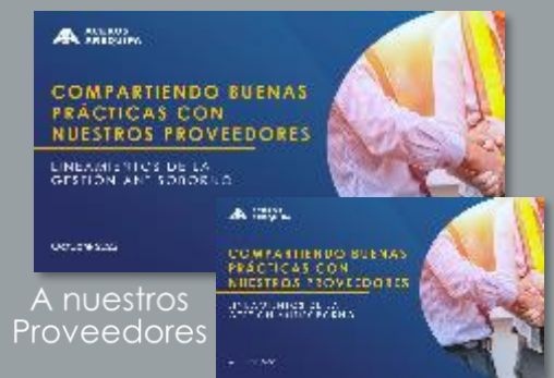
A nuestros Proveedores