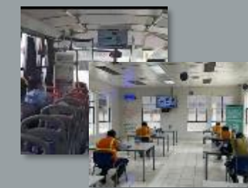
A nuestro Personal Operativo