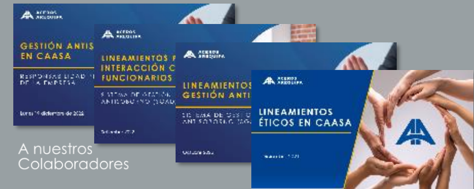
A nuestros Colaboradores